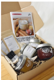
Set 1: Naturkosmetik