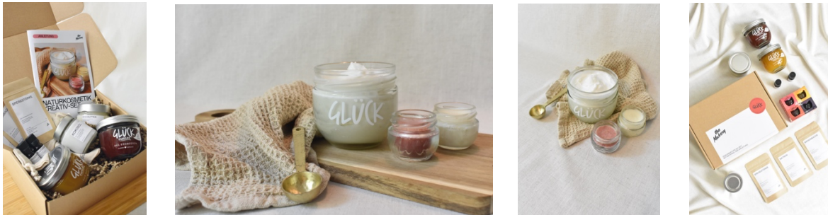
Kreativ-Set 2: Duftkerzen